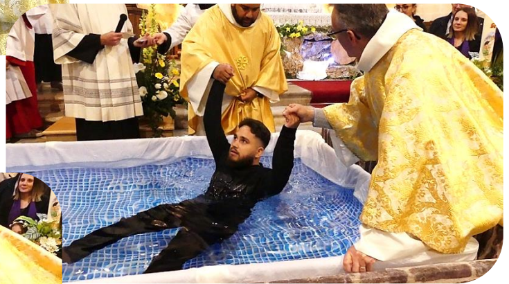
Les trois plus courageux !!!