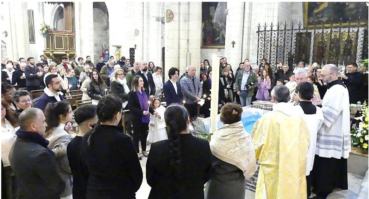
Appel des catéchumènes, des parrains et des marraines.