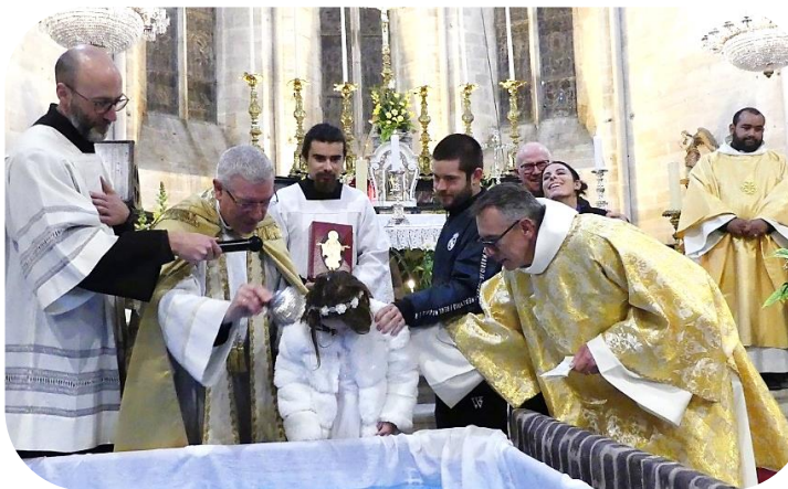
La plus jeune...